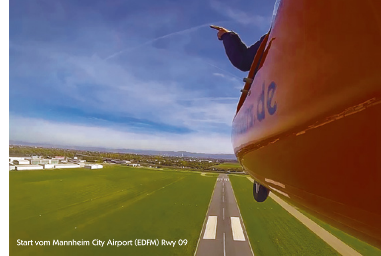
Start vom Mannheim City Airport (EDFM) Rwy 09

Sollten das Wetter so schlecht sein, dass der Flug nicht stattfinden kann, finden wir selbstverständlich zusammen mit Ihnen einen neuen Termin bei besserem Wetter. Die Entscheidung, ob der Flug stattfinden kann, trifft der Pilot, der vor dem Start den aktuellen Flugwetterbericht einholt.