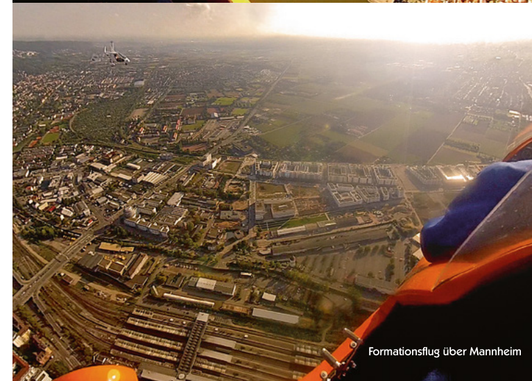
Formationsflug über Mannheim